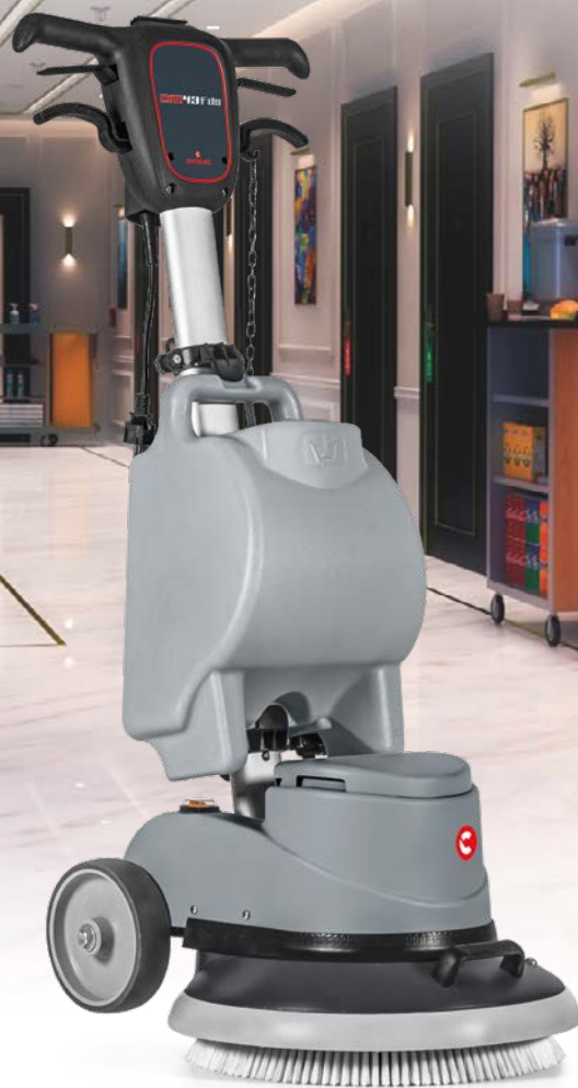
CM43 F DS Largeur de travail: 430 mm Alimentation: câble Transmission: engrenages

CM43 F DS est la monobrosse professionnelle idéale pour les entreprises de nettoyage et pour les sols des hôtels et du secteur Ho.Re.Ca. en général, mais aussi de la grande distribution et des transports.