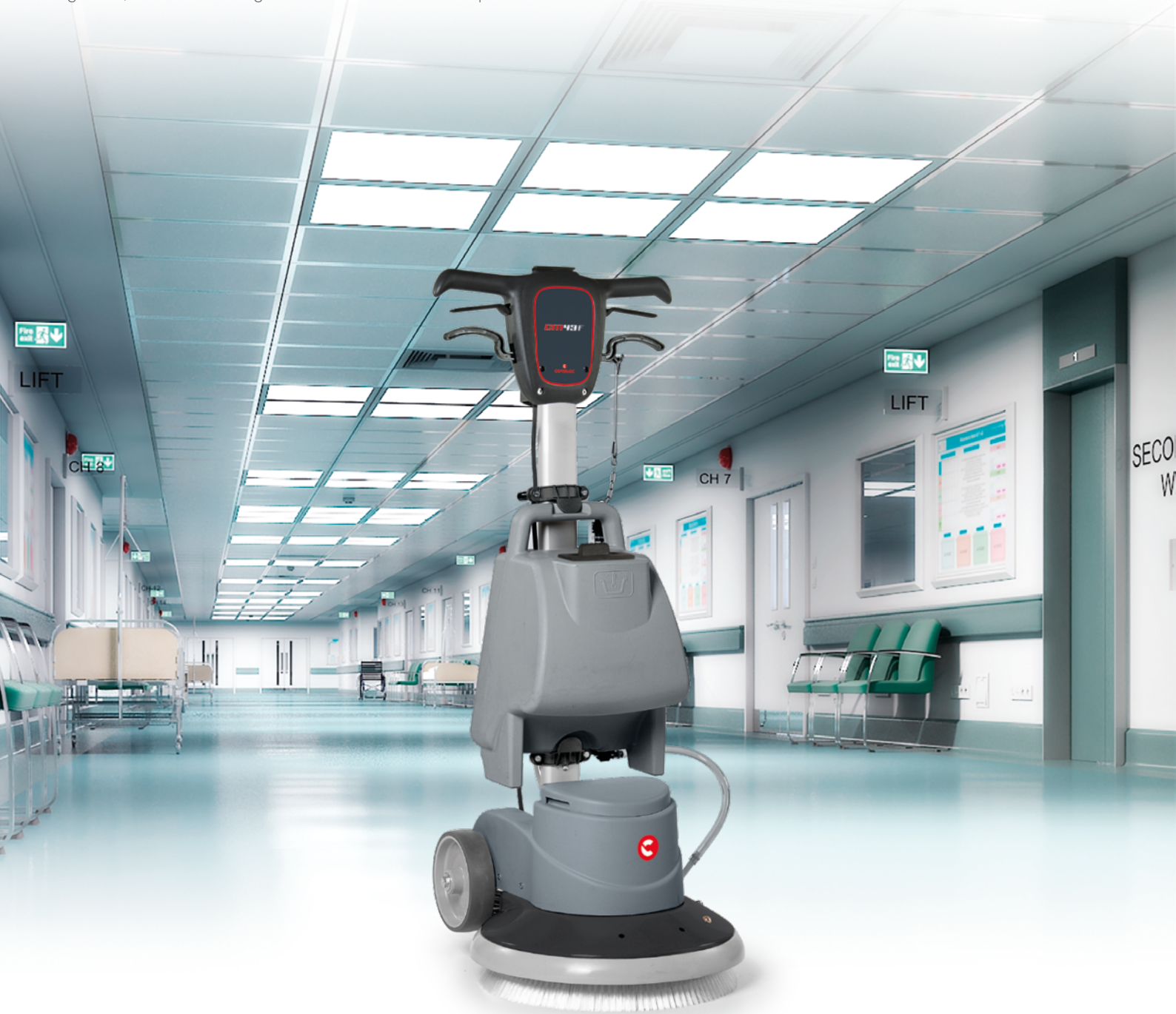
CM43 F Largeur de travail : 430 mm Alimentation : câble Transmission : engrenages

CM43 F est la monobrosse professionnelle idéale pour les entreprises de nettoyage et pour les sols des hôtels et du secteur Ho.Re.Ca. en général, mais aussi de la grande distribution et des transports.